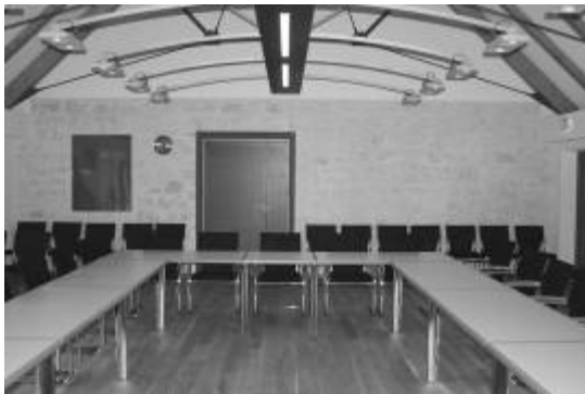
Geschickt Altes mit Neuem verbunden vormals Natursteinwand außen jetzt Sitzungssaal