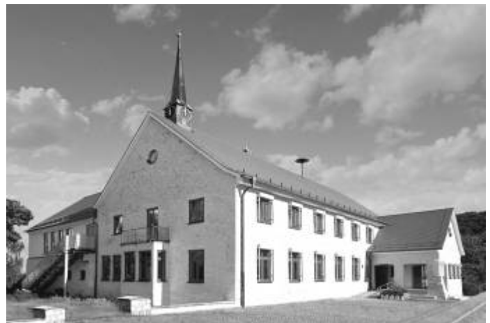
Bei einem solchen Ergebnis kann Bauen Spaß machen

Eine Zielsetzung war natürlich auch die Wahrung des charakteristischen Erscheinungsbildes.