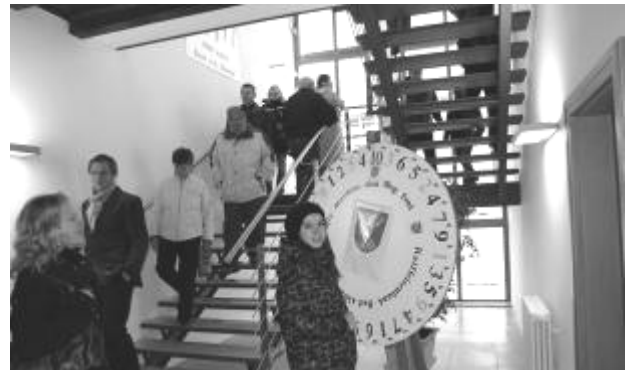
Besucher am Tag der offenen Tür

Das Projekt wurde durch das Konjunkturpaket II mit ca. 350.000 € gefördert.