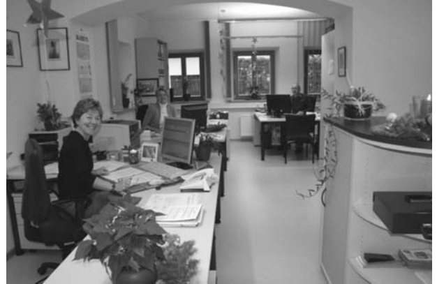
Wohlempfinden am Arbeitsplatz - Beispiel: Kassenverwaltung -